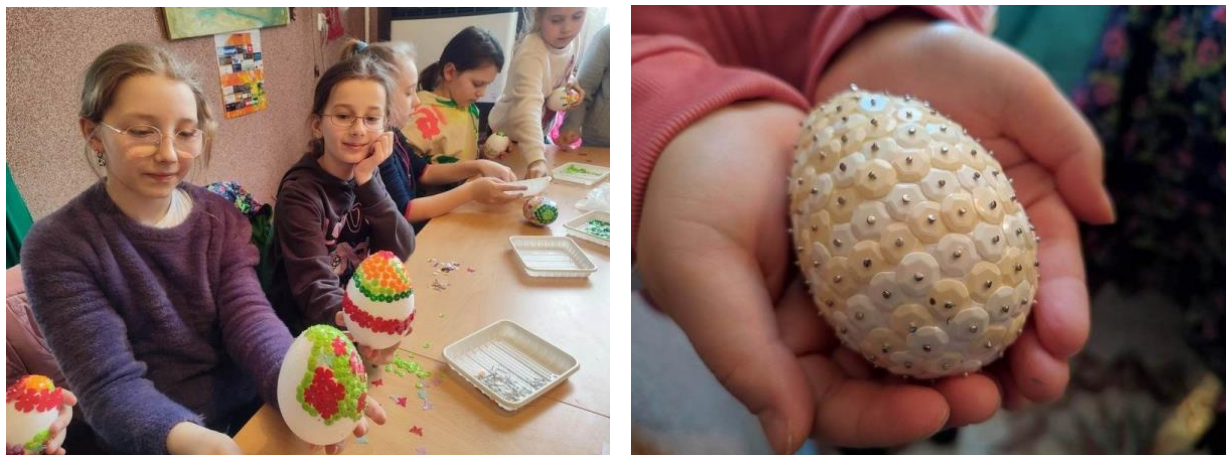
Rysunek 8 - Warsztaty rękodzielnicze

Uczestnicy warsztatów przygotowali pisanki wielkanocne