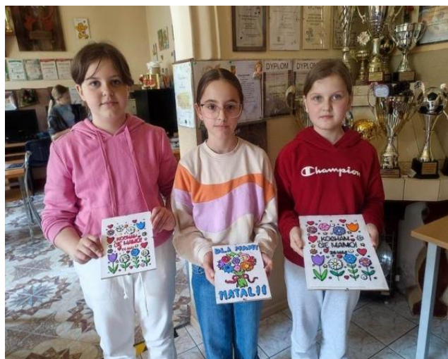
Rysunek 10 - Warsztaty rękodzielnicze