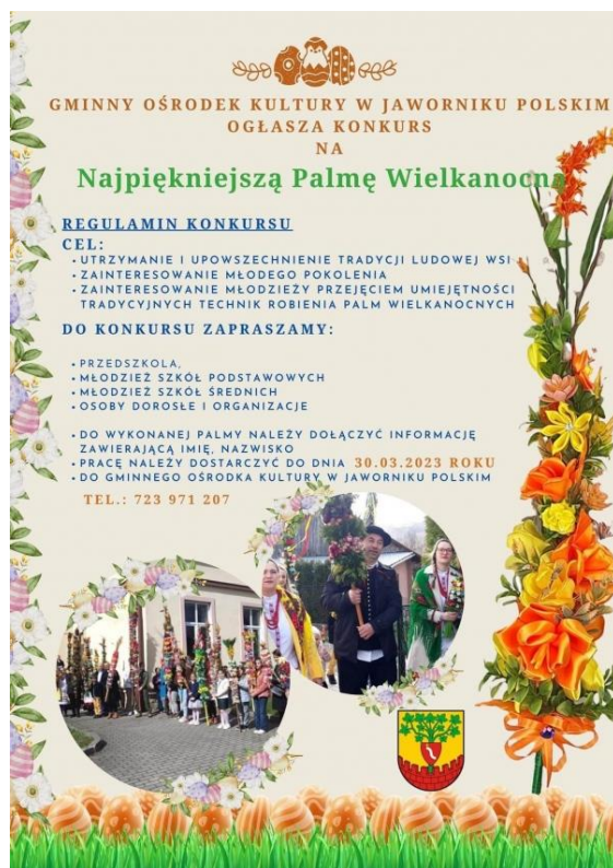
Rysunek 7 - Konkurs na najpiękniejszą palmę