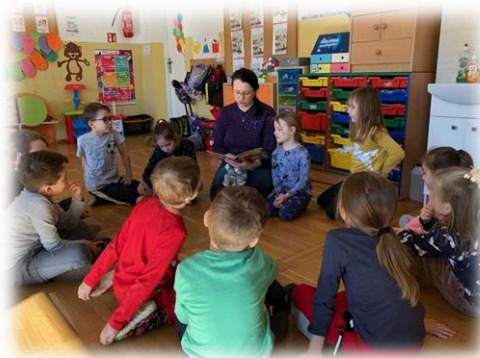
Rysunek 1- Spotkania w przedszkolach – czytanie bajeczek

Wszystkie informacje o działalności biblioteki są udostępniane na stronie internetowej biblioteki oraz na portalu społecznościowym Facebooka.