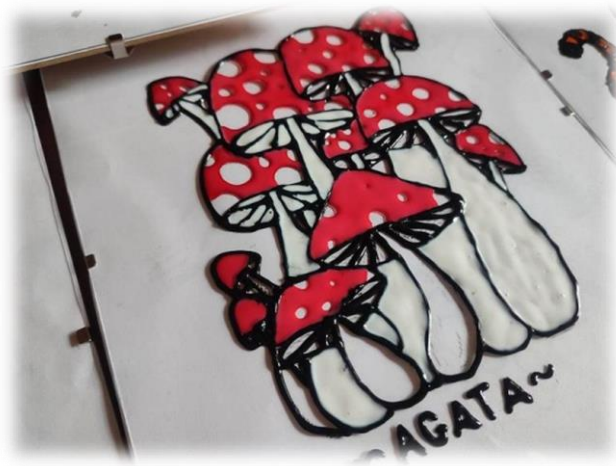
Rysunek 6 - Warsztaty kolorowe witraże

Uczestnicy warsztatów przygotowali piękne witraże.