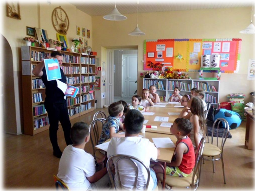
Rysunek 4 - Warsztaty muzyczne – „Jestem dumy bo jestem Polakiem” – realizacja projektu