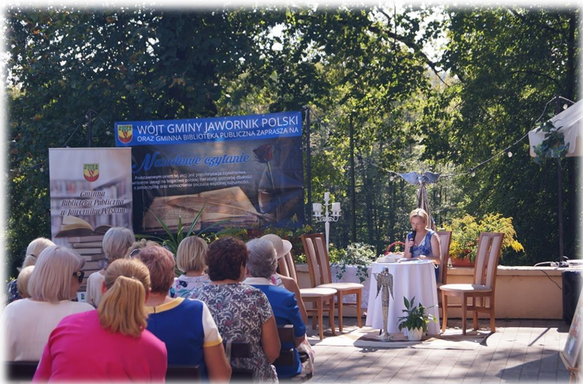
Rysunek 5 -Narodowe Czytanie „Nad Niemnem” - Elizy Orzeszkowej