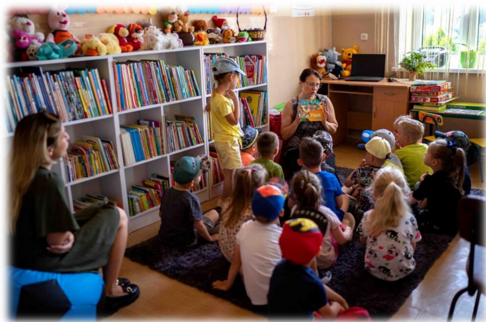
Rysunek 3 - Otwarcie kącika bibliotecznego dla dzieci