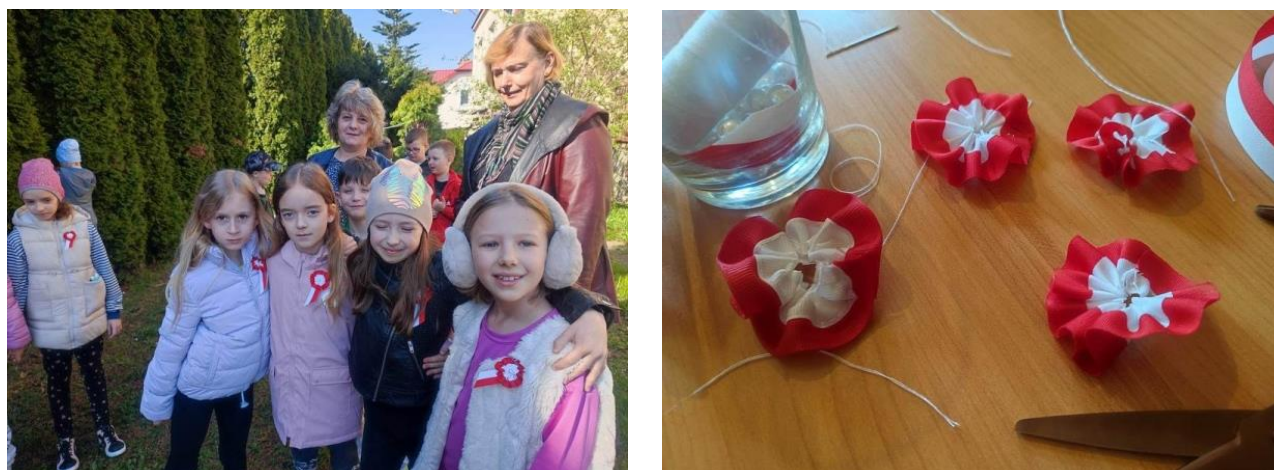
Rysunek 9 - Wykonanie kotylionów przez uczniów SP w Jaworniku Polskim

KOTYLIONY przypinamy podczas ważnych świąt państwowych do ubrania po lewej stronie.